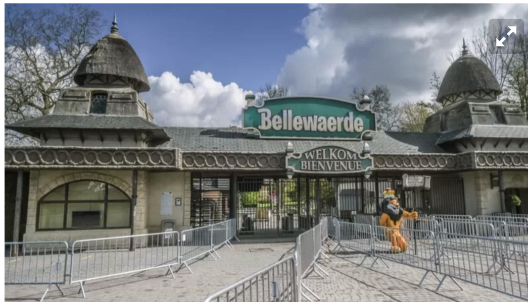
Bellewaerde © Henk Deleu